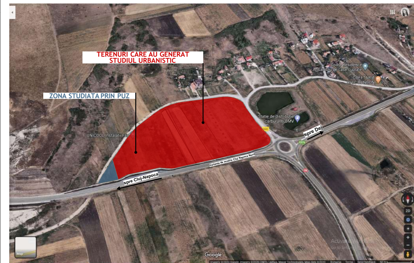
PLAN DE INCADRARE IN ZONA