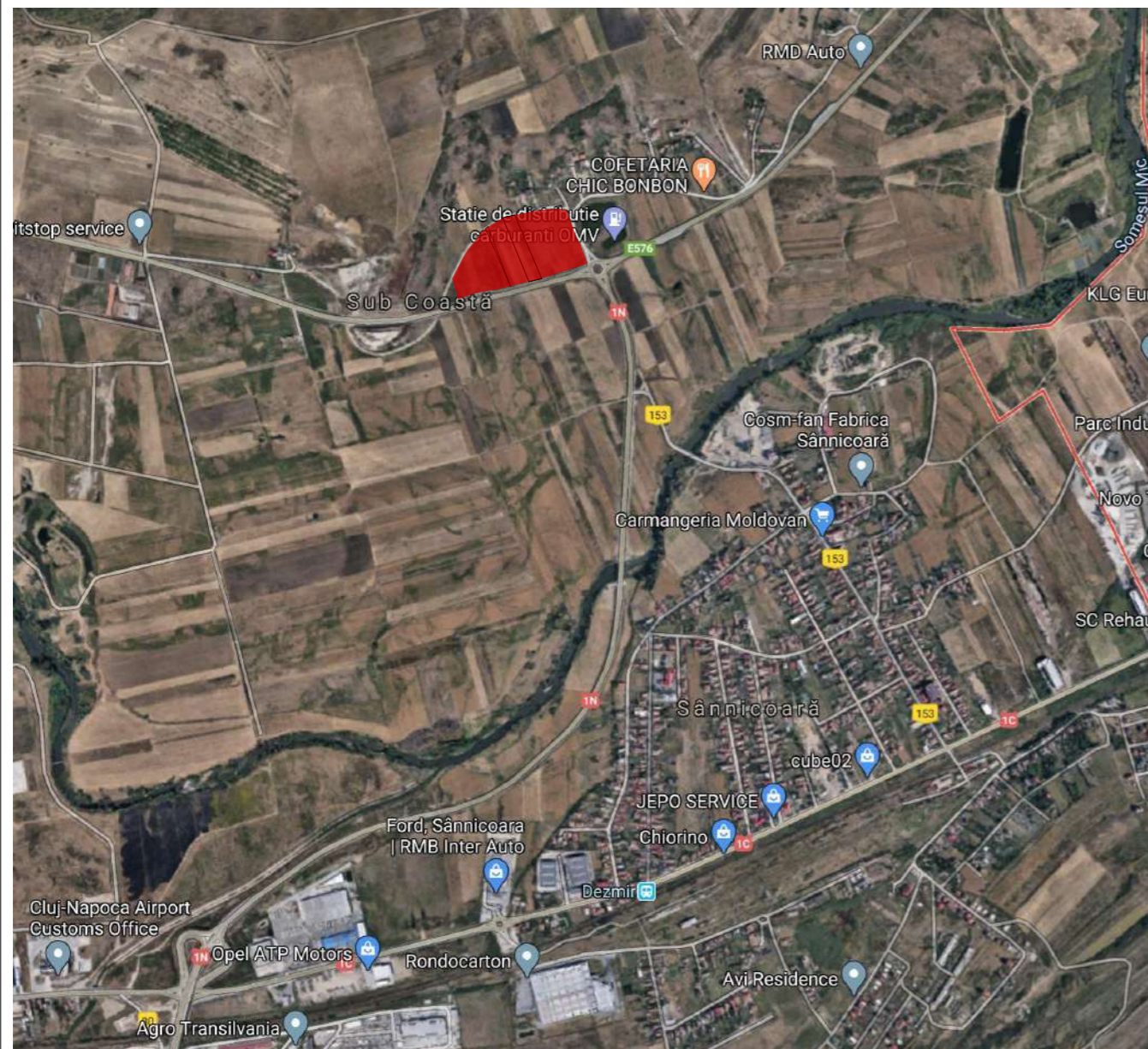
PLAN DE INCADRARE IN TERITORIU